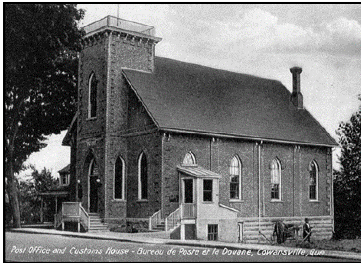
The new post office & customs office 1930 Le nouveau bureau de poste & le douanier

Le nouveau bureau de poste ouvre ses portes lundi le 28 juillet. Le douanier a aussi ses bureaux dans le même bâtiment qui abritait auparavant l'église méthodiste.