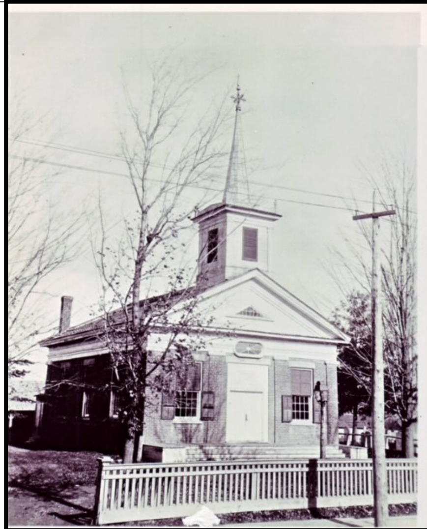
The first Congregational church 1852-1890 La première église congrégationaliste